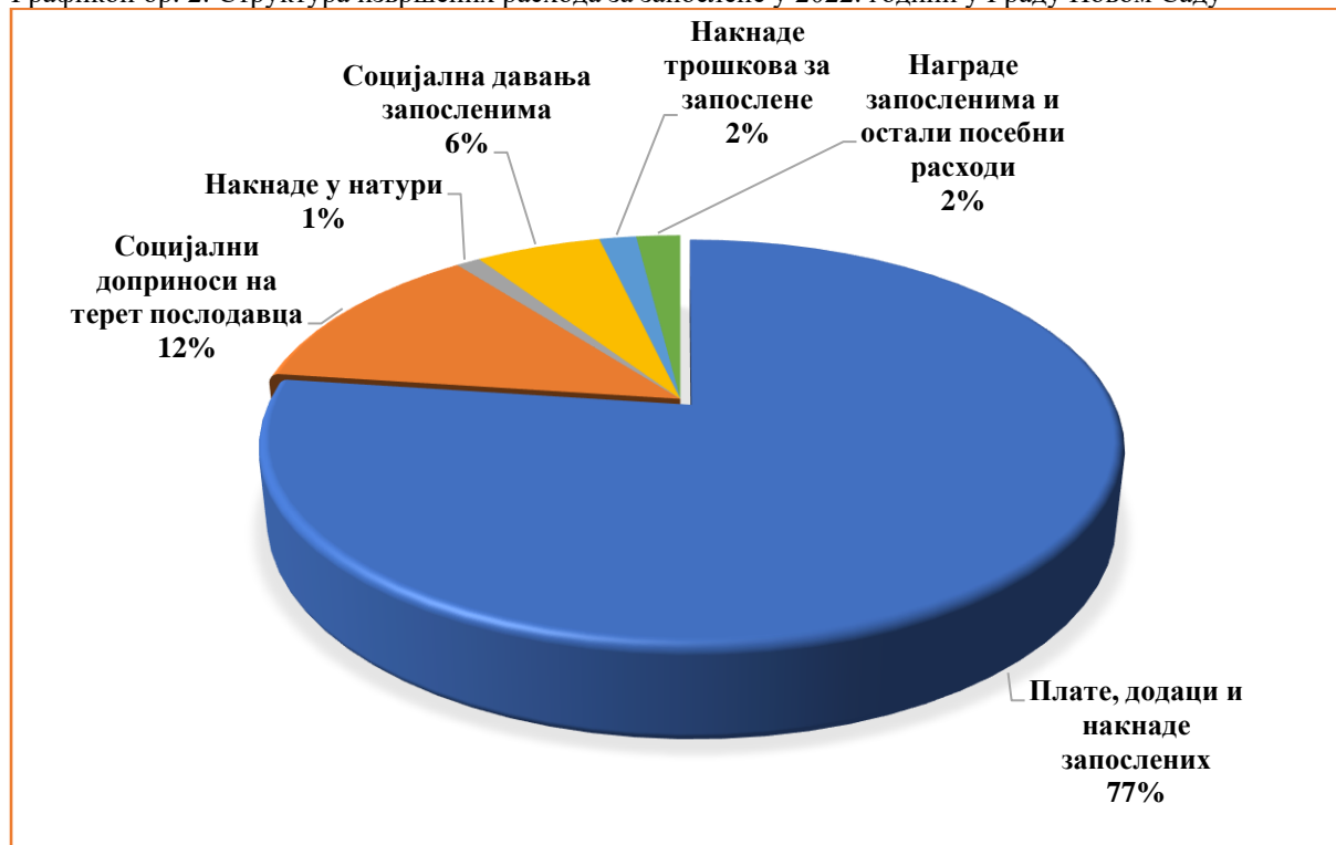
Графикон бр. 2: Структура извршених расхода за запослене у 2022. години у Граду Новом Саду